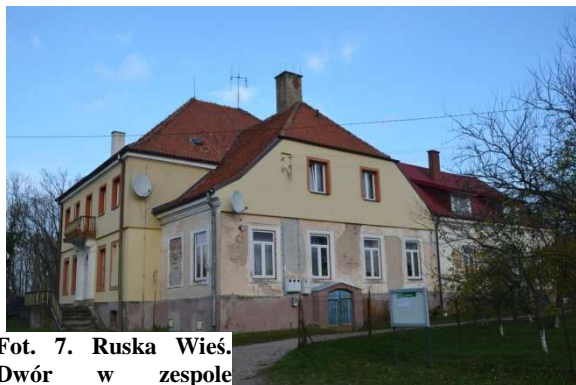
Fot. 7. Ruska Wieś. Dwór w zespole dworsko-folwarcznym.

Folwark powstał prawdopodobnie na początku XIX w. Był on nastawiony na uprawę zbóż i hodowlę bydła, istniał tu także przemysł rolno-spożywczy (gorzelnictwo). Po II wojnie światowej folwark przejęły władze polskie, po czym utworzono gospodarstwo nastawione na hodowlę bydła zarodowego.