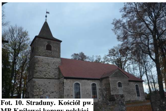
Fot. 10. Straduny. Kościół pw. MB Królowej koronv polskiej.

Kościół parafialny pw. MB Królowej Korony Polskiej (nr rejestru A-594 z 30.11.1966 r.)