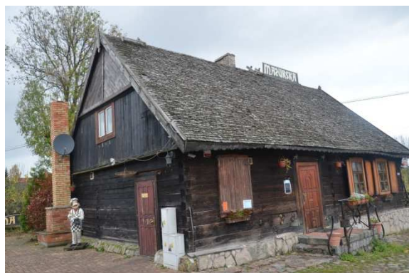
Fot. 6. oracze. Budynek mieszkalny, karczma nr 6.

Cmentarz wojenny założony niegdyś na obszarze gminy ziemskiej Karbowsken , obecnie w polu, na północ od wsi Tracze. Leży na stromym pagórku, jego owalny kształt podkreśla niski kamienny murek. Odrestaurowany, zadbane, na słupach bramy wejściowej współczesne tablice w języku polskim i niemieckim zwięźle opisujące miejsce. Na cmentarzu pochowano w wielu zbiorowych mogiłach żołnierzy armii niemieckiej i armii rosyjskiej poległych w latach 1914-1915. Znajduje się tu również duży kamienny obelisk z napisem: Besitz stirbi, Sippen sterben, Du selbst stirb wie sie. Eines nur ist, Das ewigt bleibs: Der Toten Tatenruhm.