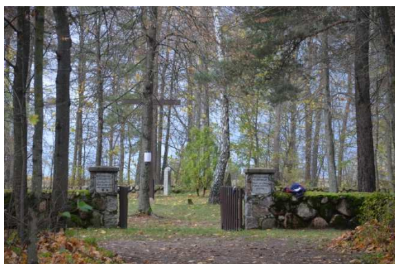
Fot. 3. Chrzanowo. Cmentarz ewangelicki, dawny.

Cmentarz położony po północnej stronie drogi Wydminy – Ełk. Użytkowany również po 1945 roku. Odrestaurowany w latach 2001-2002, o czym informuje kamień dziękczynny. Otoczony kamiennym niskim murkiem z wejściem przez drewnianą bramę. Na słupach bramy polskie i niemieckie napisy informacyjne.