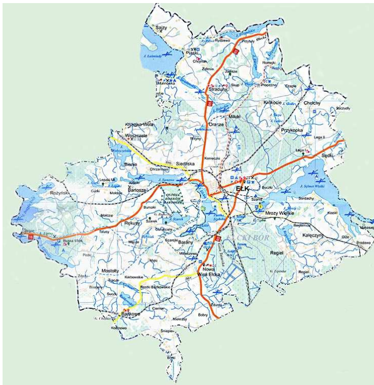
Mapa 1. Gmina Elk (podkład mapowy elk-ug.bip.eur.pl ).

Gmina Elk jest gminą wiejską położoną we wschodniej części województwa warmińsko – mazurskiego. Obejmuje ona południową część Pojezierza Elckiego, będącego środkową częścią obszaru Pojezierza Mazurskiego i jest jedną z czterech gmin powiatu elckiego. Całkowita powierzchnia gminy Elk wynosi 37 918 ha. Odległość pomiędzy miejscowościami położonymi na skraju sięga 30 km.