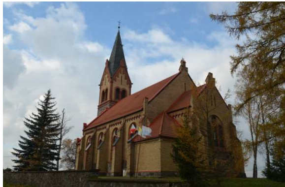
Fot. 1. Bajtkowo. Kościół parafialny pw. Matki Bożej Różańcowej.

(nr rejestru: A-2716 z 10.03.1989 r., A-3824 z 26.05.1995 r.)