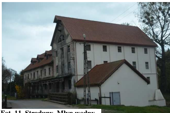
Fot. 11. Straduny. Młyn wodny.