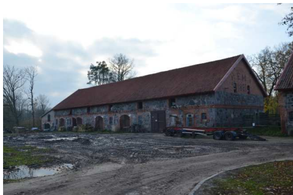
Fot. 8. Ruska Wieś. Obora w zespole dworsko - folwarcznym.

Cześć gospodarcza składa się z dwóch części: starszej (przedwojennej) - podwórze gospodarcze i nowszej (powstałej po 1945 r.) - kompleks budynków inwentarskich i zaplecza technicznego. Podwórze gospodarcze o kompozycji geometrycznej zbliżone jest kształtem do prostokąta, orientowane na osi pñ. - pñd. Kolonia mieszkaniowa posiada kompozycję rozproszoną, orientowaną wsch. - zach. i pñ. - pñd., usytuowana pierwotnie w pñ. - zach. części zespołu po obu stronach drogi Ełk - Orzysz oraz przy drodze do wsi Mostołty. Zespół datowany jest na XIX, XX w.