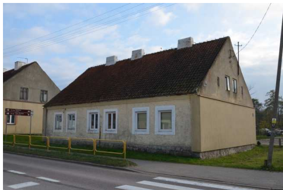
Fot. 9. Ruska Wieś. trojak w zespole dworsko-folwarcznym.