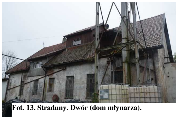
Fot. 13. Straduny. Dwór (dom młynarza).