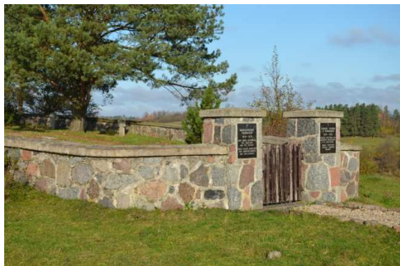
Fot. 4. Karbowski. Cmentarz wojenny z I wojny światowej.