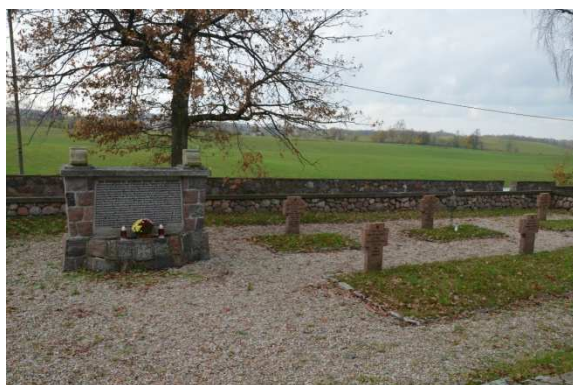
Fot. 2. Bajtkowo. Kwaterna wojenna z I wojny światowej.

Cmentarz znajduje się przy kościele, naprzeciwko głównego wejścia. Ogrodzenie stanowi kamienny mur oraz żywopłot. W części centralnej cmentarza pomnik poświęcony mieszkańcom parafii bajtkowskiej, poległym w okresie I wojny światowej. Na cmentarzu znajduje się jedenaście zbiorowych, okrawężnikowanych mogił (dziewięć niemieckich i dwie rosyjskie). Jest miejscem pochówku 37 żołnierzy armii niemieckiej, w tym 19 o znanej tożsamości oraz 23 nieznanymi żołnierzy armii rosyjskiej.