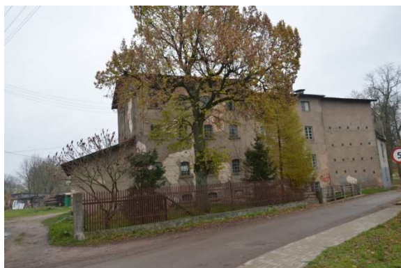
Fot. 5. Nowa Wieś Ełcka. Młyn w zespole młyńskim.

Zbudowany w 1925 r., usytuowany w centralnej części wsi, nad rzeką Ełk. Fundamenty kamienne i betonowe, ściany z cegły na zaprawie wapiennej i cementowo-wapiennej. W części produkcyjnej założony na rzucie trzech jednoprzestrzennych prostokątów połączonych w całość w jednej linii. Do nich przylegają: część mieszkalna na planie nieregularnego czworoboku i gospodarczo-administracyjna na planie wydłużonego prostokąta.