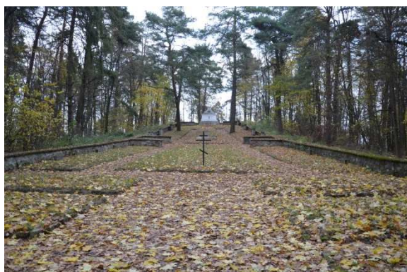
Fot. 14. Talusy. Cmentarz wojenny.