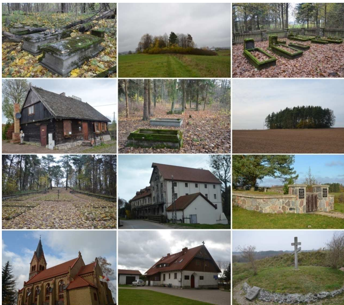
GMINA ELK LISTOPAD 2017 r.