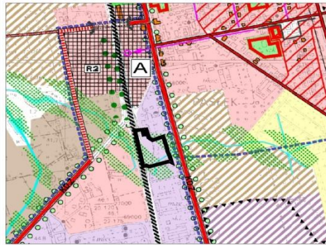
granica opracowania planu