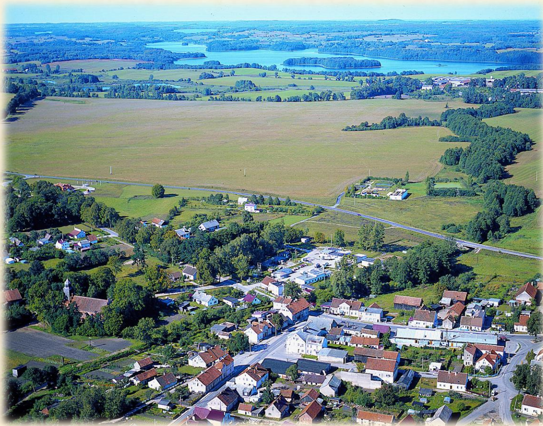
Łukta z lotu ptaka