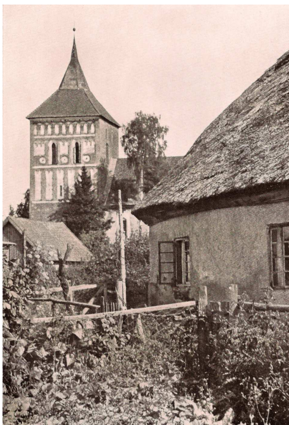
Widok na zabudowę wsi i wieżę kościoła w Szestnie

Historia ziemi mrągowskiej sięga czasów średniowiecza, kiedy to Krzyżacy podbili żyjące tu plemiona pruskie i utworzyli własne państwo. Po latach sporów z Kościołem, edyktem papieskim z 1374 roku, ustalono granicę z katolicką Warmią i ziemia mrągowska znalazła się w państwie krzyżackim. Podstawową jednostkę stanowiły tu komturie, a mniejsze – prokuratorie i wójtostwa. W latach 1401–1525 prokuratorzy krzyżaccy rezydowali na zamku w Szestnie (Seehesten), który stanowił ważne ogniwo łańcucha twierdz obronnych, rozlokowanych południkowo po zachodniej stronie Wielkich Jezior Mazurskich.