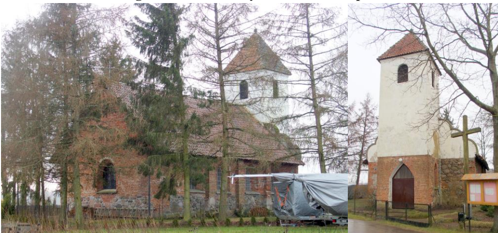
Zdjęcia nr 1, 2. Doba, kościół ewangelicki, obecnie rzymsko-katolicki pw. św. Jana Chrzciciela

• Doba, kościół ewangelicki, obecnie rzymsko-katolicki pw. św. Jana Chrzciciela