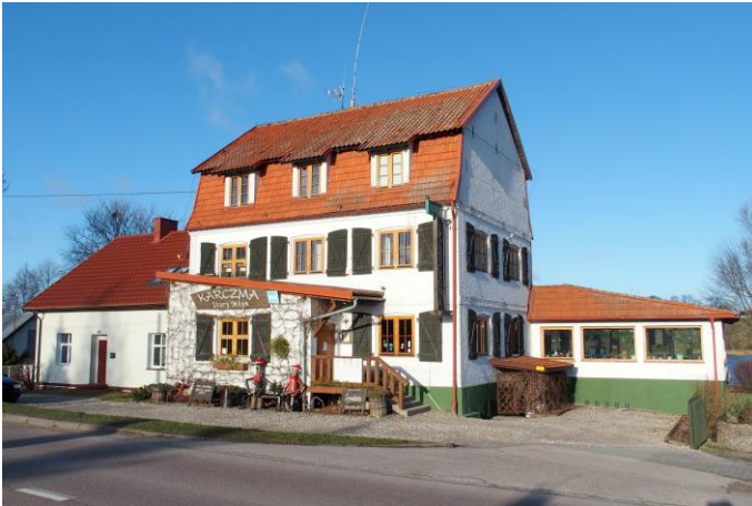
Zdjęcie nr 13. Zespół Młyna w Upałtach nr 2, ob. karczma