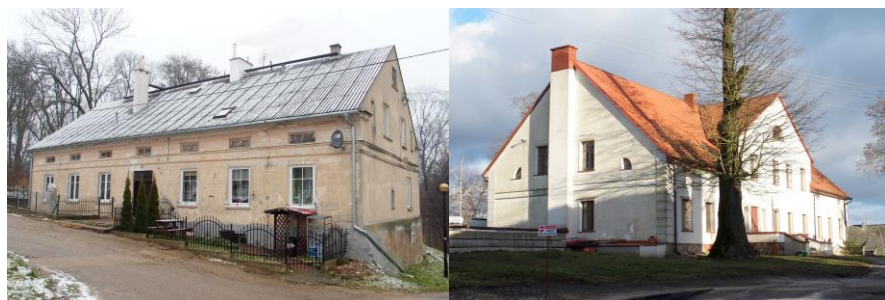
Zdjęcia nr 10, 11. Piękna Góra nr 2, Zielony Gaj nr 1