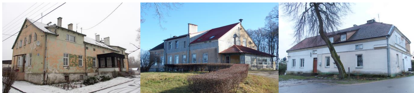
Zdjęcia nr 7, 8, 9. Bystry nr 7, Gorazdowo nr 5, Kalinowo nr 3

Pozostałe dwory są istotnym, historycznym dziedzictwem kulturowym. Prezentują walory typowe dla budownictwa mieszkalnego okresu 4 ćw. XIX w.-1ćw. XX w.