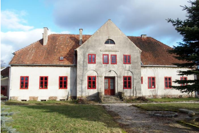
Zdjęcie nr 3. Nowe Soldany nr 13, dwór w zespole dworsko-folwarcznym, ob. budynek mieszkalny

Obiekt wzniesiony w 1 ćw. XX w., w szacie neoklasycyzmu. Budynek na rzucie prostokąta, w części podpiwniczony, parterowy, z dwukondygnacyjnym ryzalitem zwieńczonym trójkątną wystawką – na osi fasady, nakryty naczółkowym dachem i dwuspadowym dachem wystawki. Analogiczny ryzalit w elewacji tylnej, poprzedzony murowaną werandą. Ściany murowane, tynkowane, na cokole licowanym kamieniem polnym. Elewacje gładko tynkowane, w przyziemiu ryzalitu – trzy płytkie arkadowe blendy, w zwieńczeniu ścian – schodkowy gzyms. Wnętrze dwutraktowe.