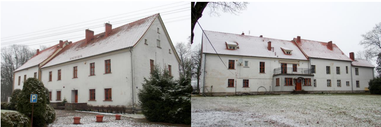
Zdjęcia nr 4, 5. Pierkunowo nr 1, dwór, ob. budynek mieszkalny

Budynek pochodzi z 1880 r., 1 ćw. XX w., brak cech stylowych. Złożony z dwóch, dwukondygnacyjnych, lekko zróżnicowanych członków na rzucie prostokąta, nakrytych dwuspadowymi dachami i niższego dwukondygnacyjnego aneksu. W fasadzie dobudowany współcześnie ganek. Budynek murowany, tynkowany, pozbawiony detali architektonicznych.