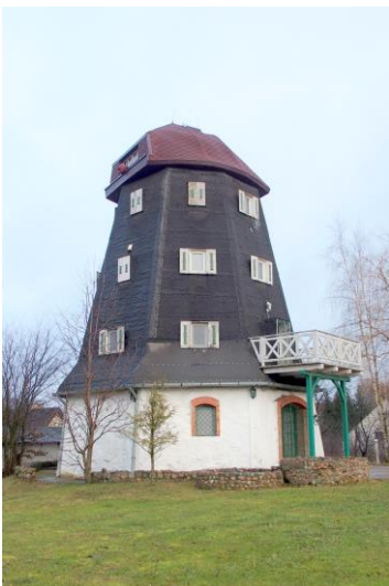
Zdjęcie nr 12. Wiatrak holenderski w Sterławkach Małych