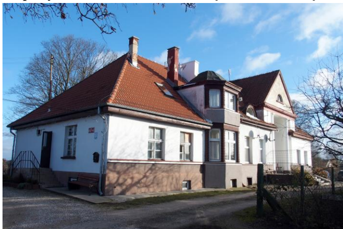
Zdjęcie nr 6. Upałty Małe nr 8, dwór, ob. budynek mieszkalny

Budynek wzniesiony w pocz. XX w., zapewne wg projektu architekta z Olecka, H. Thieme. Po wojnie budynek przekształcony w dom wielorodzinny. Podpiwniczony, parterowy budynek złożony z dwóch prostokątnych części, lekko zróżnicowanych w wysokości, nakryty dwoma trójspadowymi dachami. Fasada niesymetryczna: w części płd. – rozczłonkowana dwukondygnacyjnym ryzalitem z wgłębnym portykiem zwieńczonym trójkątnym szczytem wspartym na parze kolumn w porządku wielkim. W drugiej części – dwukondygnacyjny aneks zamknięty trójbocznie. Elewacje gładko tynkowane, bez detali. Zmieniony kształt okien.