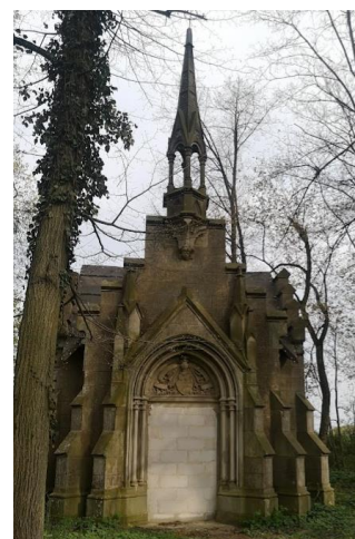
Fotografia 5. Widok na Kaplicę grobową Albertsów w Truplu.

Obiekt jest objęty ochroną poprzez wpis do rejestru zabytków.