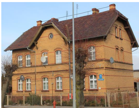
Fotografia 12. Widok na dom pracowników kolei przy ul. Kolejowej 7.

Fizyczne przecięcie linii w kierunku Jabłonowa nastąpiło w 1925 roku, kiedy wybudowano nową 14 kilometrową trasę Kisielice – Biskupiec Pomorski. Po klęsce Polski w Kampanii Wrześniowej w 1939 Niemcy odbudowali torowisko i przywrócili ruch pociągów w kierunku Jabłonowa. Taki stan utrzymywał się do 1945 roku, kiedy po przegranej przez Niemcy II wojny światowej i zajęciu tych terenów przez wojska radzieckie nastąpiła rozbiórka linii kolejowej na odcinku Kisielice – Kwidzyn. Polskie władze prawdopodobnie planowały jej odbudowę, ponieważ na zachowanym rozkładzie jazdy z 1946 roku widnieje dopisek: „Na odcinku Kisielice – Kwidzyn pociągi na razie nie kursują”. Do odbudowy jednak nigdy nie doszło. Linia Kisielice – Biskupiec Pomorski Miasto funkcjonowała do 1969 roku, a jej rozbiórka nastąpiła w 1974. W tym momencie Kisielice przestały być węzłem kolejowym.