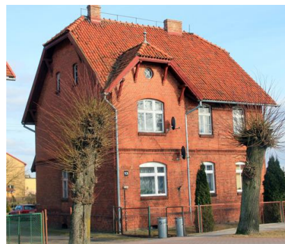
Fotografia 11. Widok na dom pracowników kolei przy ul. Kolejowej 13.