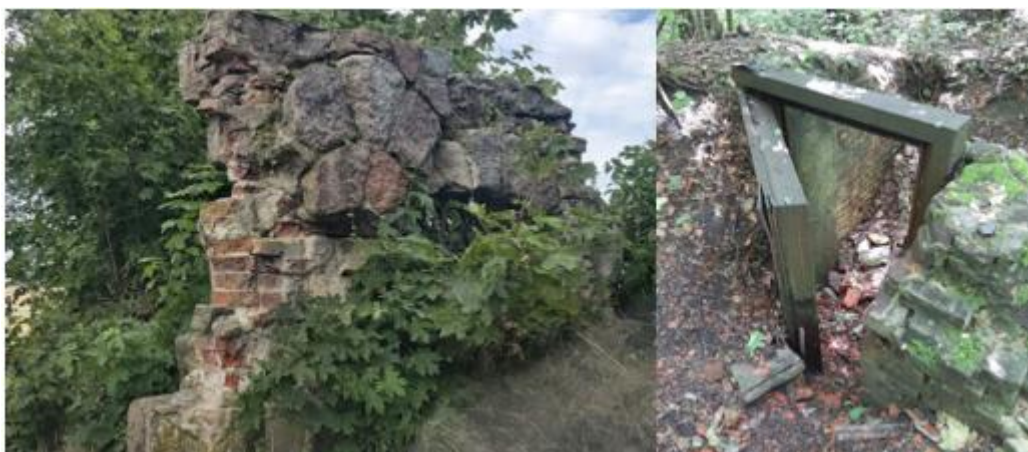
Fotografia 9. Widok na ruiny bramy wjazdowej i pałacu w Ogródzieńcu.

W chwili obecnej widoczne są tylko fragmenty bramy wjazdowej prowadzącej na teren pałacu, zarys bryły fundamentowej i porozrzucane fragmenty murów.