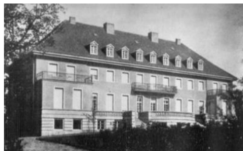
Fotografia 8. Archiwalne zdjęcie pałacu w Ogrodzieńcu.

Była to budowla murowana z cegły i otynkowana, dwukondygnacyjna z użytkowym poddaszem, podpiwniczona. Wzniesiono ją na planie prostokąta i przykryto dachem ceramicznym czterospadowym, z umieszczonymi od strony ogrodu lukarnami. W fasadzie frontowej usytuowano ryzalit zwieńczony trójkątnym szczytem i z reprezentacyjnym wejściem w przyziemiu. W elewacji ogrodowej, dwa skrajne ryzality stanowiły podstawy do wyodrębnienia na poziomie drugiej kondygnacji tarasów otoczonych balustradami. Trzeci taras znajdował się na parterze budynku, a po obu jego stronach znajdowały się schody wiodące do ogrodu (powyżej znajdował się również balkon). W elewacjach umieszczone były prostokątne okna w ozdobnych obwódkach gzymsowych.