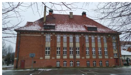
Fotografia 14. Widok na Budynek Szkoły Zespołu Szkół w Kisielicach.

Budynek został wybudowany w 1913 r. Usytuowany jest w pół-wsch. części miasta, na parceli pomiędzy ul. Daszyńskiego a Wojska Polskiego, sąsiadującej od wschodu z terenem Urzędu Miasta i Gminy a od zachodu z terenem dawnej mleczarni. Budynek bez wyraźnie określonych cech stylowych z elementami antykizującymi secesji oraz neobaroku (portal, sygnaturki, pilastrowanie). Dokonano poprawy stanu zabytkowego budynku