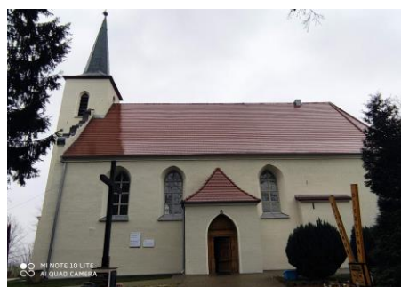
Fotografia 4. Widok na Kościół p.w. Niepokalanego Poczęcia Maryi Panny w Łęgowie.

Stan zachowania dobry, prowadzono prace konserwacyjne: