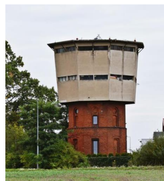
Fotografia 10. Widok na wieżę wodną.

Projekt budowy linii Prabuty – Jabłonowo Pomorskie datowany jest na ok. 1896 rok i miał połączyć istniejącą już linię Malbork – Hawa z linią Toruń – Hawa. Prace budowlane nie trwały długo, bo już 1 października 1899 roku na 48,6 kilometrową trasę wyjechały pierwsze składy. Linia Prabuty – Jabłonowo nigdy nie miała dużego znaczenia, gdyż służyła przede wszystkim do przewozu ludzi i produktów rolnych. Wszystkie stacje na