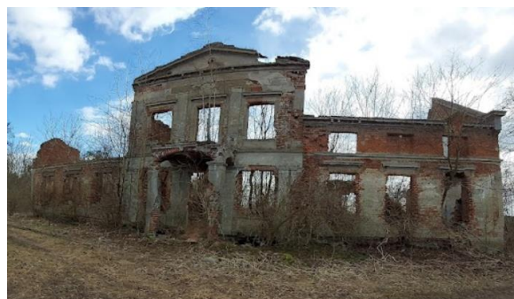
Fotografia 7. Widok na ruiny pałacu w Limży.

Prawdopodobnie pod koniec XV wieku Limża wraz z jeziorem zostały sprzedane Hansowi von Kospoth. Po 1700 roku wieś stała się własnością państwa pruskiego. Za zasługi w wojnach śląskich przeciwko Austrii pułkownik Otto