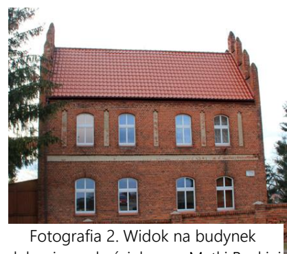
Fotografia 2. Widok na budynek plebani przy kościele p.w. Matki Boskiej Królowej Świata w Kisielicach.