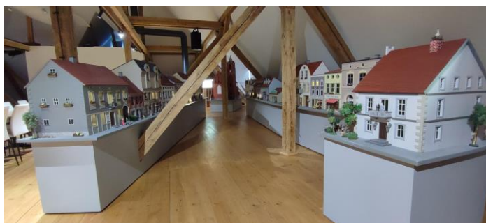
Fotografia 17. Widok na izbę pamięci w Kisielicach.

W Kisielicach na wyremontowanym poddaszu budynku szkoły utworzono Izbę Pamięci, która prezentuje dokumenty dotyczące historii ziemi kisielickiej, ważnych dla Kisielic osobistości, pełniąc też rolę mini-muzeum dokumenty dotyczące historii ziemi kisielickiej, ważnych dla Kisielic osobistości, pełniąc też rolę mini-muzeum. Głównym eksponatem w Izbie Pamięci jest wykonana przez artystę plastyka makietą nieistniejącego Rynku Starego Miasta Kisielice, która została odtworzona w skali 1:20 zabudowy Rynku Starego Miasta Kisielice z początku XX wieku oddający tym samym klimat tamtego czasu. Atrakcją Izby Pamięci jest sterowiec „Hindenburg” odtworzony w skali 1:40.”.