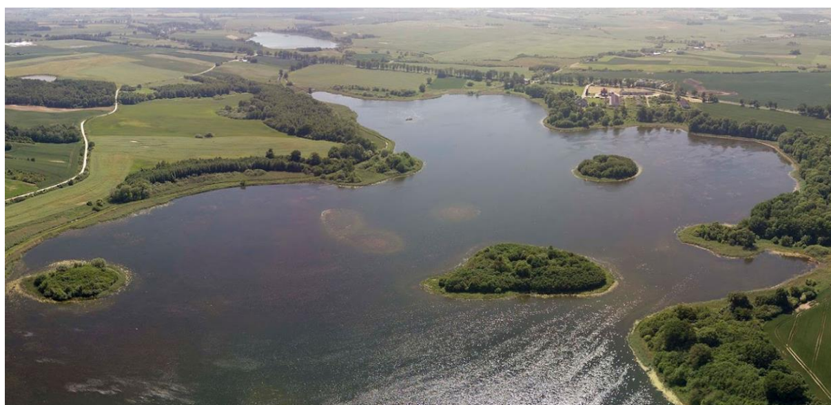
Fotografia 16. Widok na wysepki na stawie Łodygowo – wpisane do rejestru zabytków.