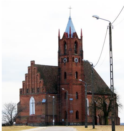
Fotografia 1. Widok na Kościół p.w. Matki Boskiej Królowej Świata w Kisielicach.