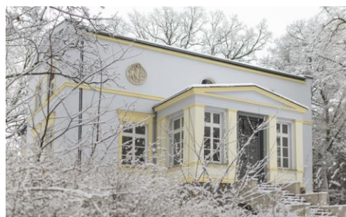
Fotografia 6. Widok na dwór w Krzywce po renowacji (fot. D.Stark).

Znajdujący się tu majątek został utworzony jeszcze w czasach krzyżackich. Pierwotnie pełnił funkcję folwarku pomocniczego dóbr z siedzibą w miejscowości Święte [obecnie w powiecie grudziądzkim]. Majątek ten otrzymali na mocy przywileju bracia Arnold i Berthold. W XVI wieku dobra te stanowiły własność rodziny von Szembek. W XVII wieku nabył je starosta