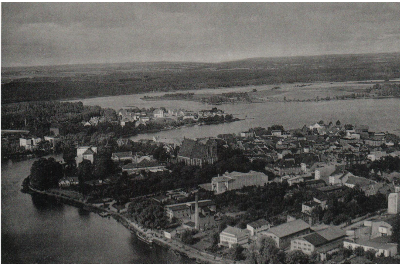
Stare Miasto z widoczną bryłą kościoła gotyckiego, fotografia lotnicza

Ławski kościół p.w. Przemienienia Pańskiego zbudowany został w latach 1317-1325 w stylu gotyckim. Renesansowa wieża kościoła została dobudowana w 1550 roku, a w 1624 roku dobudowano kruchtę. Kościół był kilkakrotnie przebudowywany. Potocznie nazywany jest przez mieszkańców Ławy „czerwonym”. Z początkiem założenia miasta wiąże się historia budowy kościoła, który powstał na miejscu drewnianej kaplicy pod wezwaniem św. Mikołaja patrona rybaków i marynarzy. Został pobudowany w najwyższym punkcie wzgórza, na którym usytuowane jest Stare Miasto Ławy i pełnił funkcje kościoła zakonnego ( Ordenskirche ). Datę budowy kościoła (1317-1325) potwierdza XIX-wieczna pieczęć ławskiej parafii z wizerunkiem kościoła i napisem w otoku „ Die Kirche im Dt. Eylau 1318 ”.