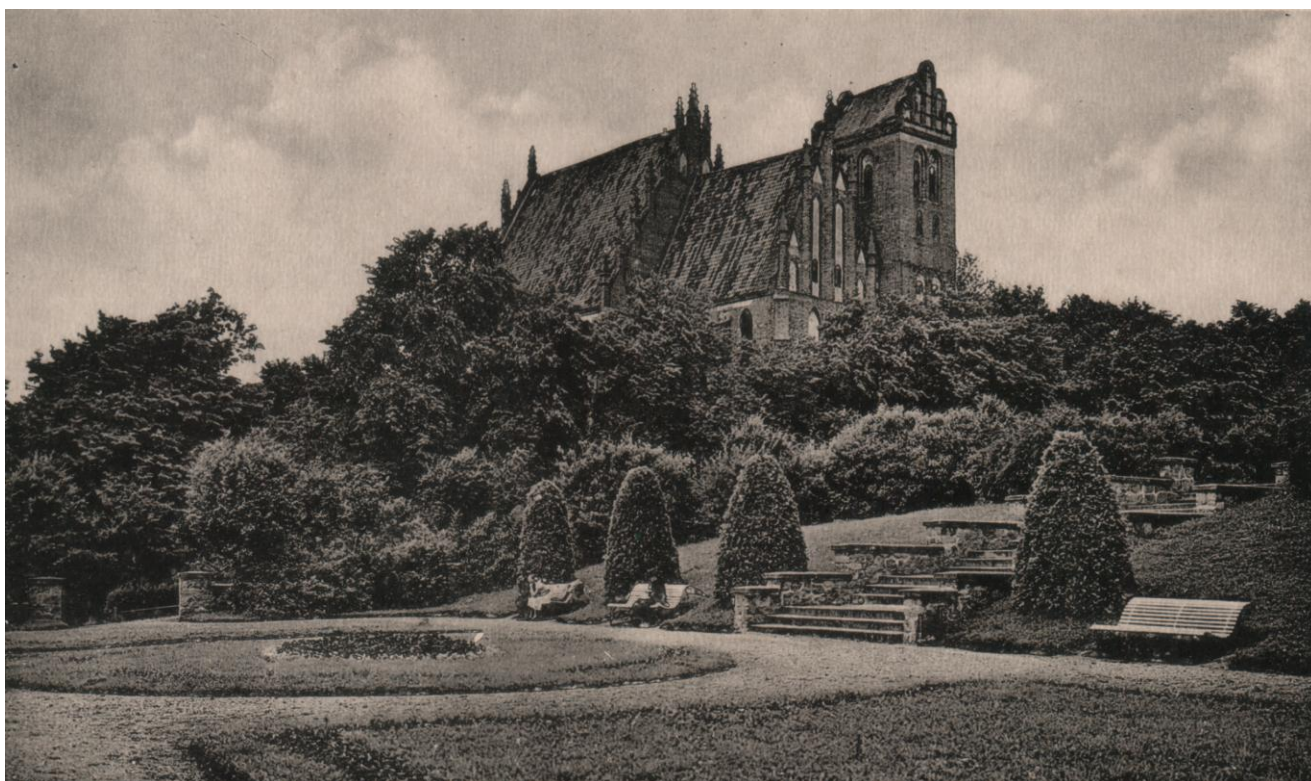
Kościół gotycki znad brzegu Małego Jezioraka

jednonawowej budowli na planie prostokąta z prezbiterium o wymiarach 8 x 11,7 m i nawą główną o wymiarach 14,8 x 20,2 m. Przy prezbiterium postawiono wysoką na 27 m wieżę. W północnej części znajduje się dziedziniec, na którym od początku mieścił się cmentarz. Początkowo na cmentarzu wokół kościoła grzebano zmarłych, ale w XVIII wieku wyznaczono oddzielny cmentarz. Wzmianka o pierwszym remoncie kościoła oraz o tym, iż kościół posiadał cztery dzwony znajdujące się na renesansowej wieży, pochodzi z XVI wieku. W latach 1642-1643 rozpoczęto remont dachu, murów przyległych do kościoła i zabudowań kościelnych. Remont dachu niestety nie został ukończony i w 1673 roku w czasie deszczu uszkodzone zostały organy. Pomimo trudności finansowych miasta, dziury zostały załatane, a pod koniec XVII wieku odremontowano organy. W 1733 roku cztery dzwony ze względu na zły stan zostały zdjęte i przekazane jako surowiec na potrzeby przemysłu wojennego. W ich miejsce odlano nowe dzwony. W 1740 roku parafianie ufundowali nowy rokokowy ołtarz, a rok później pomalowane zostało wnętrze kościoła. W 1751 roku wyremontowana została zakrystia. Niestety w 1753 roku podczas burzy w kościół uderzył piorun. W płomieniach stanął dach świątyni. Ogień strawił dach, a podczas gaszenia pożaru zalane zostały organy. Wkrótce zostały one wyremontowane oraz dokonano niezbędnych remontów ołtarza i pomalowano kościół.