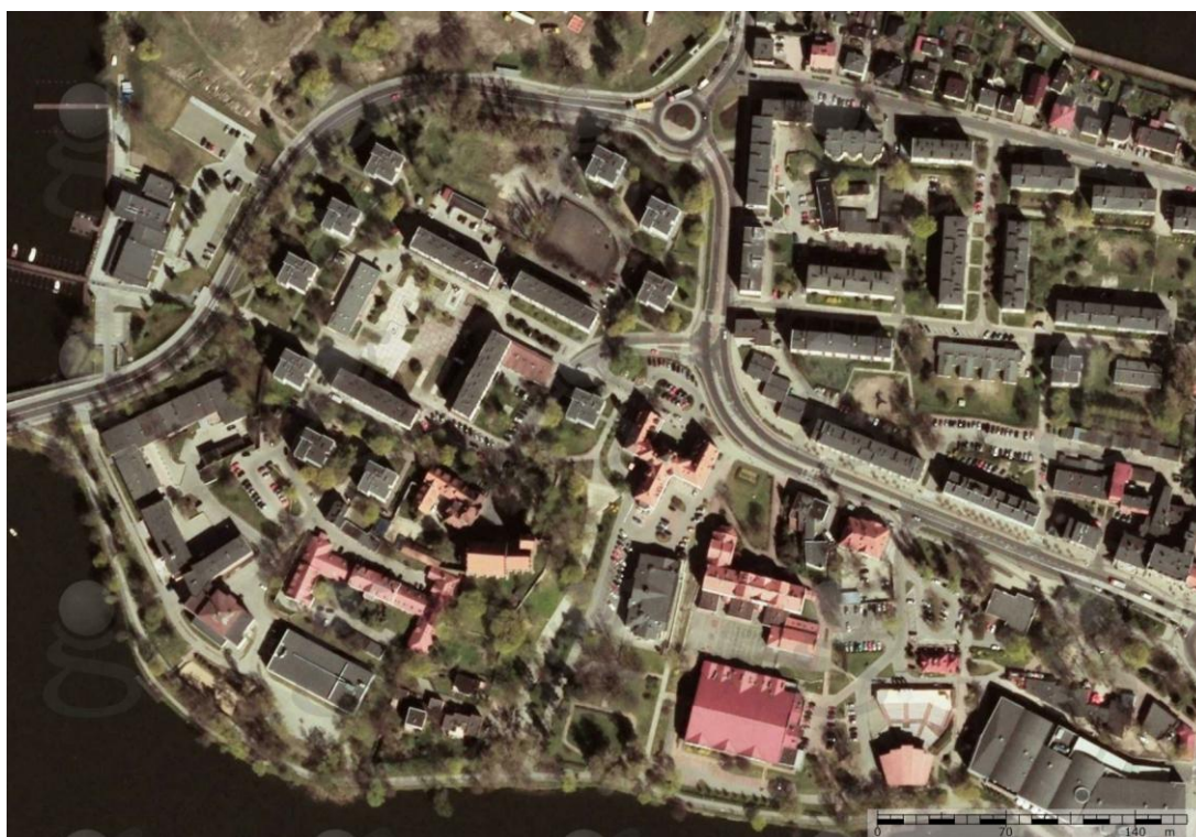
Stare Miasto w Iławie w czasach współczesnych

J. Kaufmann, Geschichte der Stadt Deutsch Eylau, Danzig 1905.