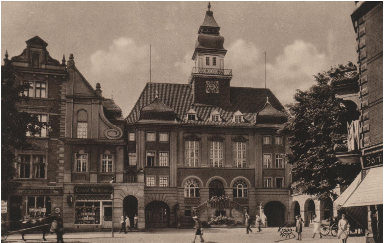
Budynek ratusza, skrzydło zachodnie