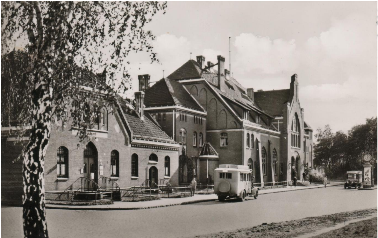
Budynek dworca kolejowego