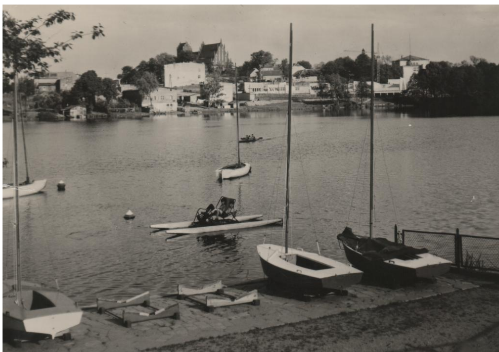
Centrum Iławy z perspektywy brzegu Jezioraka

II wojna światowa zniszczyła miasto w prawie 80%, a jego zabytkowe centrum w 43%. Ubytki mieszkaniowe rekompensowano w latach sześćdziesiątych przez budowę bloków spółdzielczych oraz rozbudowę wspomnianych wcześniej osiedli w rejonie ul. Kwidzyńskiej, Grudziądzkiej, Chełmińskiej i Gdańskiej, u południowych brzegów Małego Jezioraka. Duże osiedle spółdzielcze zlokalizowano jeszcze dalej na południe, w obrębie ul. Wiejskiej i 1 Maja, czyli tzw. Osiedle Podleśne oraz podobne w obrębie ul. 1 Maja, Wiejskiej, Smolki i Andersa, zwane Osiedlem Trzydziestolecia. Znacznie rozbudowano zapoczątkowane przed wojną osiedle przy szosie ostródzkiej w obrębie ul. Ostródzkiej, Rolnej i Owocowej. Nowe osiedle, tzw. Lipowy Dwór, powstało w miejscu dawnej wsi o tej nazwie, na północ poza Iławką, w przedłużeniu ul. Dąbrowskiego w kierunku na Boreczno. Niewielkie osiedle domków zlokalizowano pomiędzy dawnym cmentarzem ewangelickim a torami kolejowymi, w pobliżu Jeziora Iławskiego. Tym nowym inwestycjom towarzyszyła widoczna dbałość o rewaloryzację lub nawet rekonstrukcję starej, cennej substancji, z dawnym ratuszem na czele.