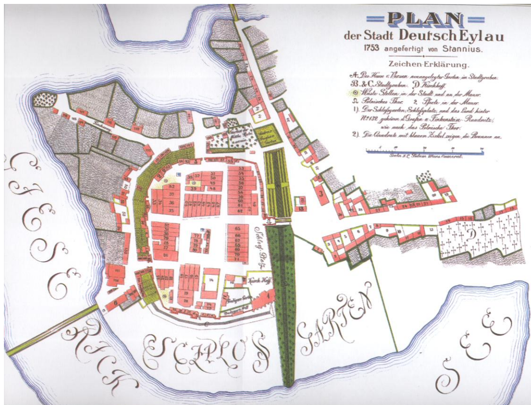
Rozplanowanie Starego Miasta w Iławie na planie z 1753 r.

J. Kaufmann, Geschichte der Stadt Deutsch Eylau, Danzig 1905.