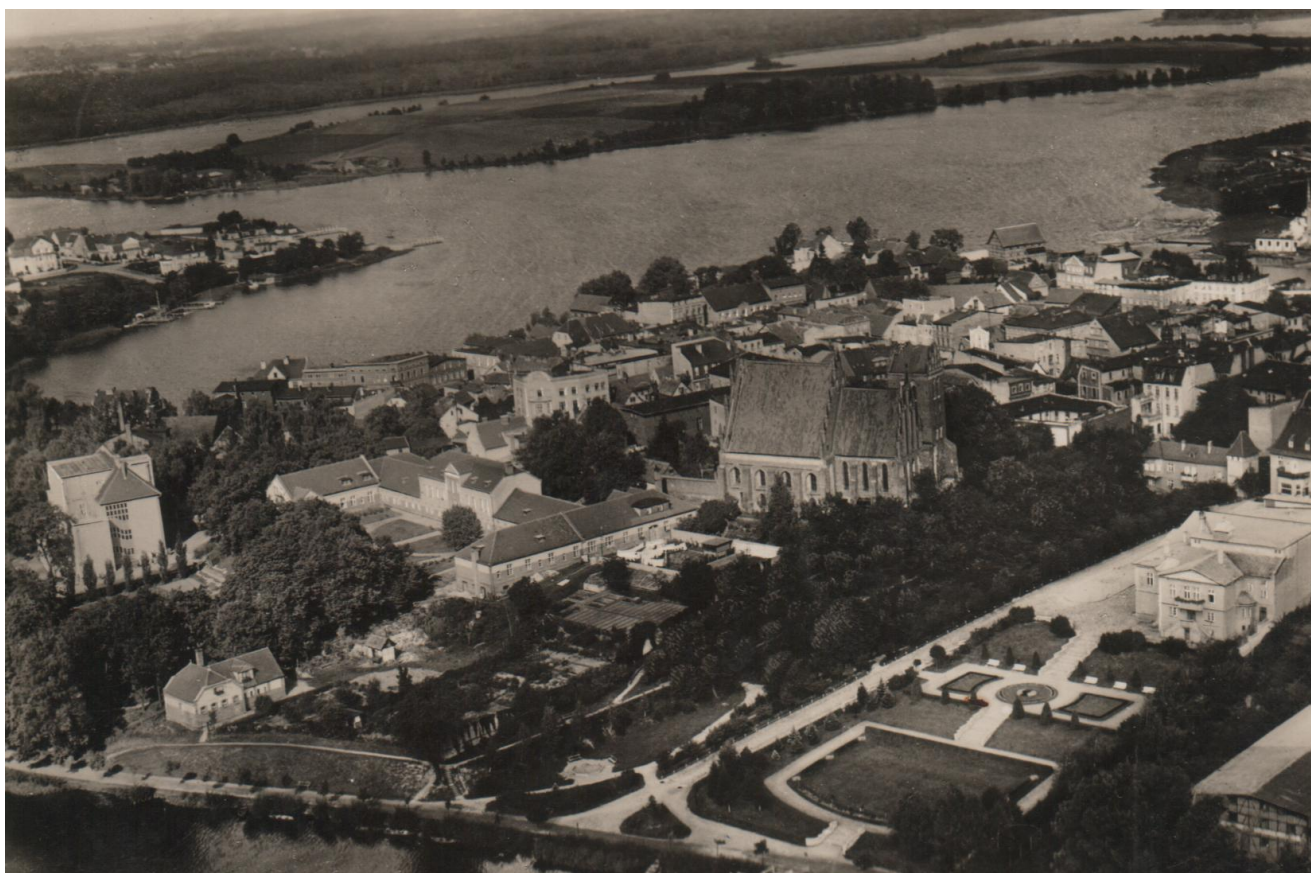
Stare Miasto, fotografia lotnicza

z nadbudówką pełniącą później funkcje aresztu miejskiego oraz z przystawioną od strony miasta wartownią. Na odcinku północno-wschodnim istniała trzecia brama, zwana Bramą Wodną. Szachownica ulic, złożona z ulic wybiegających pod kątem prostym z każdego rogu rynku, podzieliła zabudowę miejską na osiem bloków. Dwa bloki, północny i południowy, przecięte były dodatkowo tzw. ulicami tylnymi o charakterze gospodarczym. Wzdłuż murów miejskich, wokół miasta, biegła ulica okólna. W 1540 roku miasto liczyło w obrębie murów 70 domów, 4 domy budnicze i 7 przymurnych. Ważną rolę odgrywał drewniany most nad Jeziorkiem, zwany „Długim”, wspomniany w zapiskach z 1520 roku. Drugi most znajdował się na Iławce i nazywany był „Krótkim”.