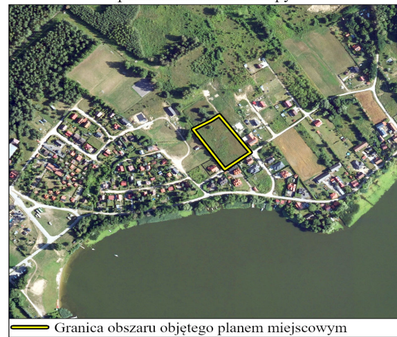
Granica obszaru objętego planem miejscowym