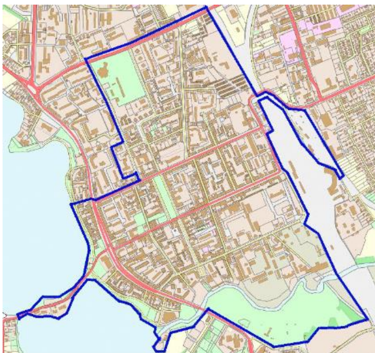
Rys. nr 1. Obszar śródmieścia w mieście Ełk wyznaczony do rewitalizacji, źródło: Program Rewitalizacji Ełku na lata 2016 - 2023

w śródmieściu Ełku powinien mieć wielofunkcyjny charakter. Ze względu na centralne położenie na szlaku prowadzącym z dworca kolejowego w stronę ełckiej promenady, powinien pełnić funkcję ważnej przestrzeni publicznej w mieście, skupiając mieszkalnictwo oraz bogatą i różnorodną ofertę usługową, pozwalającą na żywotne funkcjonowanie tego miejsca o różnych porach dnia/tygodnia/roku. W granicach „Śródmieścia” znalazł się również teren Ełckiej Kolei Wąskotorowej (jednej z największych atrakcji turystycznych Ełku) oraz tereny przy Jeziorze Ełckim i rzece Ełk. Plany rozwojowe tych terenów sprawiają, że będą one pełniły istotną rolę w rewitalizacji obszaru przyczyniając się do poprawy jakości życia i aktywizacji mieszkańców „Śródmieścia”. Przeprowadzone działania doprowadzą do zwiększenia atrakcyjności turystycznej i wizerunkowej miasta, zachowania dziedzictwa kulturowego, wzrostu jakości i różnorodności oferty kulturalnej, sportowo - rekreacyjnej, wypoczynkowej oraz rozwoju przedsiębiorczości.